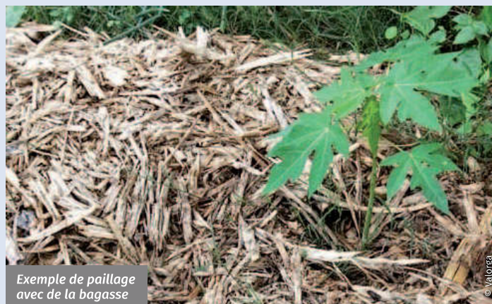
Exemple de paillage avec de la bagasse

Son utilisation est préconisée en arboriculture, culture vivrière, fourragère ou en prairie. En maraîchage, son application doit être effectuée a minima quinze jours avant l'implantation des cultures.